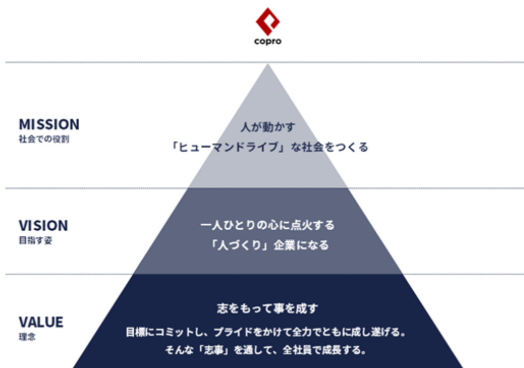
「コプロ・グループの経営理念体系図」

本中期経営計画期間においては、パーパスの示す方向性に沿って、エンジニア一人ひとりのキャリアアップと、それを応援する幅広いサービスや仕組みを具備した「エンジニア応援プラットフォーム」の構築を軸に、建設技術者派遣・紹介サービス、及び機電半導体技術者派遣・請負サービスの拡大、組織能力の強化、組織の活性化を図る各種施策や制度設計を計画的に進めることで、持続的な成長、並びに中長期的な企業価値の向上に努めてまいります。